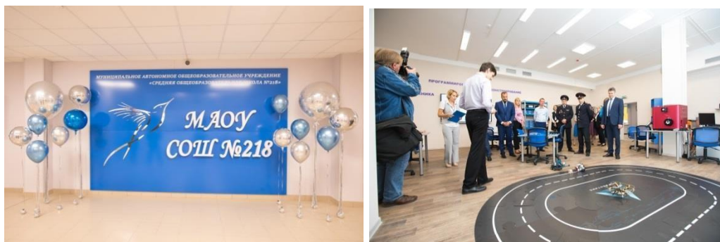
Рис.3. Организация предметно-пространственной среды МАОУ СОШ №218

Символ школы – серебряная птица, устремленная ввысь. Располагается на первом этаже в центральном холле. Птица издревле является символом трудолюбия, полёта мыслей и фантазий. Если внимательно присмотреться, птица непростая, в ней легко узнаются математические символы.