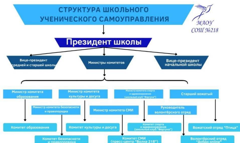
Рис.1. Структура школьного ученического самоуправления МАОУ СОШ №218

Основная цель института самоуправления учащихся в МАОУ СОШ №218 заключается в создании условий для выявления, поддержки и развития управленческих инициатив обучающихся, принятия совместных с педагогами решений, а также для включения обучающихся школы в вариативную коллективную творческую и социально-значимую деятельность. Участие в самоуправлении даёт возможность подросткам попробовать себя в различных социальных ролях, получить опыт конструктивного общения, совместного преодоления трудностей, формирует личную и коллективную ответственность за свои решения и поступки.