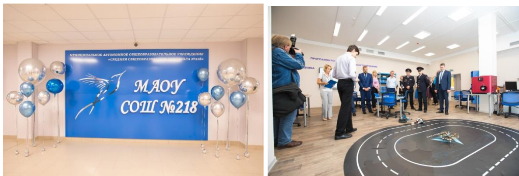
Рис.3. Организация предметно-пространственной среды МАОУ СОШ №218

Символ школы – серебряная птица, устремленная ввысь. Располагается на первом этаже в центральном холле. Птица издревле является символом трудолюбия, полёта мыслей и фантазий. Если внимательно присмотреться, птица непростая, в ней легко узнаются математические символы.