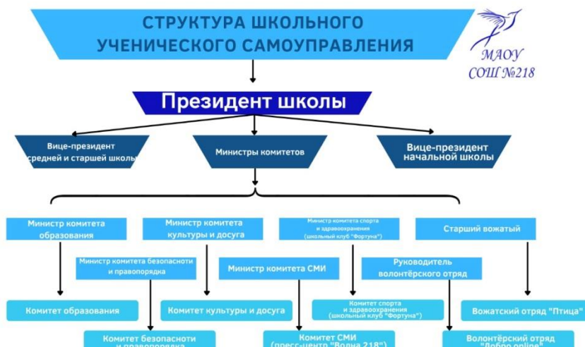
Рис.1. Структура школьного ученического самоуправления МАОУ СОШ №218

Основная цель института самоуправления учащихся в МАОУ СОШ №218 заключается в создании условий для выявления, поддержки и развития управленческих инициатив обучающихся, принятия совместных с педагогами решений, а также для включения обучающихся школы в вариативную коллективную творческую и социально-значимую деятельность. Участие в самоуправлении даёт возможность подросткам попробовать себя в различных социальных ролях, получить опыт конструктивного общения, совместного преодоления трудностей, формирует личную и коллективную ответственность за свои решения и поступки.