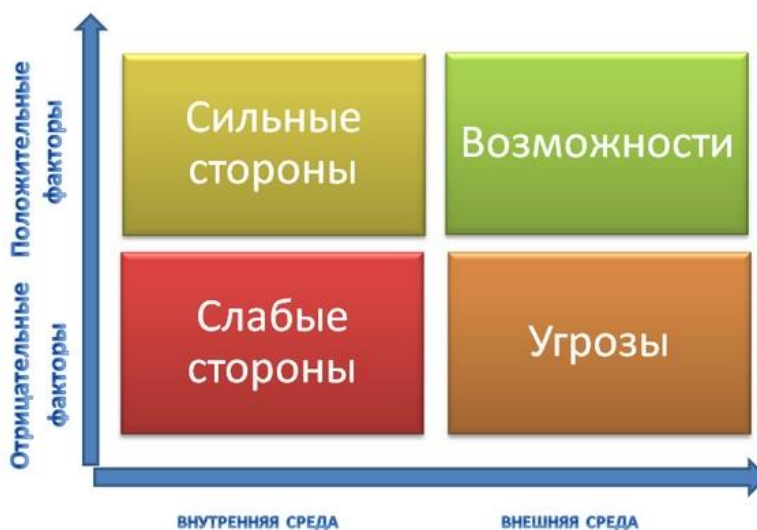
Рис.4. SWOT-анализ состояния воспитательной системы

Самоанализ осуществляется ежегодно. В качестве эффективного инструмента выбран SWOT-анализ состояния воспитательной системы МАОУ СОШ №218, который заключается в определении сильных и слабых сторон воспитательного процесса, с целью максимизировать благоприятные возможности и снизить возможные риски.